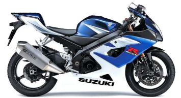
Suzuki GSX-R1000 (2005-2006)