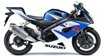
Suzuki GSX-R1000 (2005-2006)